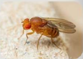
แมลงวันทอง