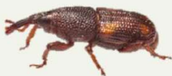
ด้วงวงข้าว