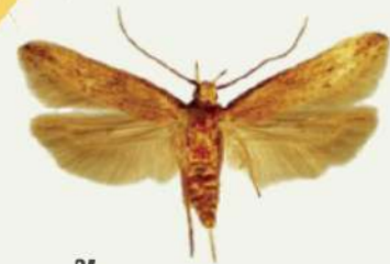
ผีเสื้อข้าวเปลือก