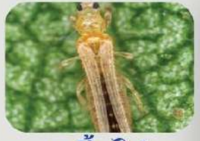
เพลี้ยไฟ