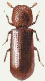
มอดข้าวเปลือก