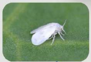
แมลงหวี่ขาว

ประเทศไทยเป็นหนึ่งในประเทศผู้ส่งออกพืชผัก ผลไม้ และไม้ดอก ชนิดต่างๆซึ่งมักพบปัญหาการปนเปื้อนของแมลงศัตรูพืชกักกันหลายชนิด เช่น เพลี้ยไฟ แมลงหวี่ขาว และแมลงวันทอง การจำกัดศัตรูพืชกักกันเพื่อการส่งออกที่ได้การยอมรับจากทั่วโลก คือ การใช้สารรม (Fumigant) เนื่องจากมีประสิทธิภาพในการกำจัดแมลงเกือบทุกชนิดและทุกระยะการเจริญเติบโต วิธีการไม่ยุ่งยาก และหากปฏิบัติตามคำแนะนำการใช้อย่างเคร่งครัด จึงจะมีความปลอดภัย