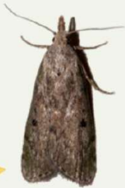
ผีเสื้อข้าวสาร