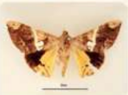
ตัวเต็มวัยเพศเมีย