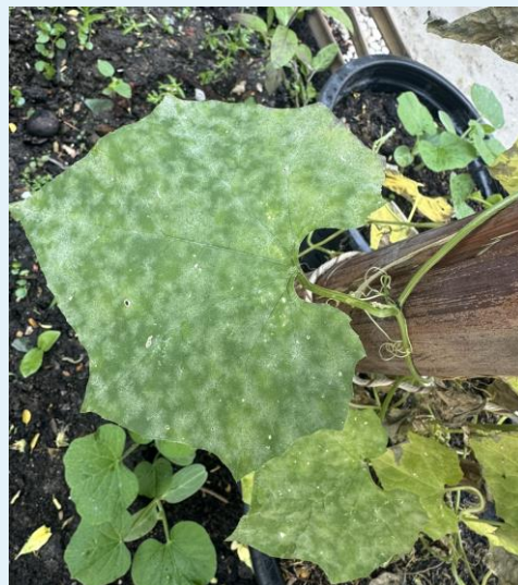
ราแป้งที่พบบนใบบวบ

พืชตระกูลแตง : แตงกวา แตงร้าน แตงโม แตงไทย เมล่อน แคนตาลูป ชูกินี ฟักทอง ฟักเขียว ฟักแม้ว มะระจีน และบวบ