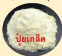
ปุ๋ยเกล็ด