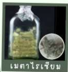
เมตาไรเซียม

3. หากพบการระบาดรุนแรงให้ใช้สารเคมี กลุ่มได กลุ่มหนึ่ง ฉีดพ่นทรงพุ่ม เช่น