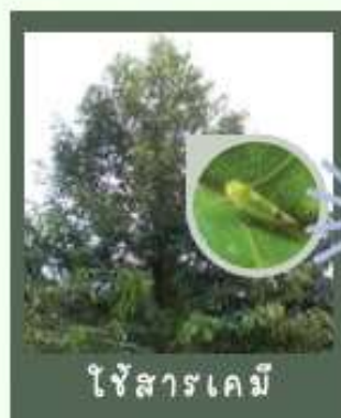
ใช้สารเคมี

โดยพ่นทุก 7 วัน ติดต่อกัน 2-4 ครั้ง ต้องสลับกลุ่มสารทุก 30 วัน เพื่อลดความต้านทานต่อสารเคมี