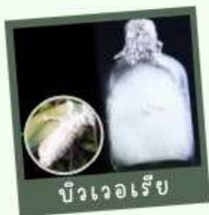
บีวเวอเรีย

หากเริ่มพบการระบาด พ่นเชื้อราบีวเวอเรีย หรือเมตาไรเซียม อัตรา 1 กิโลกรัม ต่อน้ำ 80 ลิตร ทุก 15 วัน ติดต่อกัน 2-3 ครั้ง