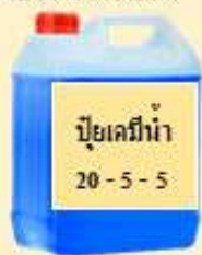
ปุ๋ยเสริมธาตุ 20 - 5 - 5