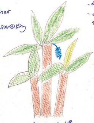
อายุ 10-12 ปี พบกาชกล้วย