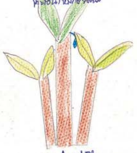
อายุ 6-8 ปี พบกาชกล้วย