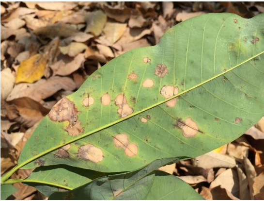
เริ่มแรกเกิดรอยช้ำค่อนข้างกลมบริเวณใต้ใบ