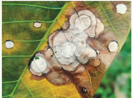
จำนวนแผลมากกว่า 1 จุด เจริญลุกลาม ซ้อนกันเป็นแผลขนาดใหญ่