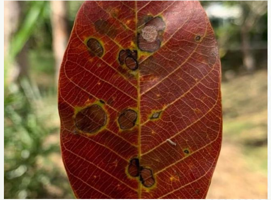
จุดแผลซ้ำสีคล้ำค่อนข้างกลม