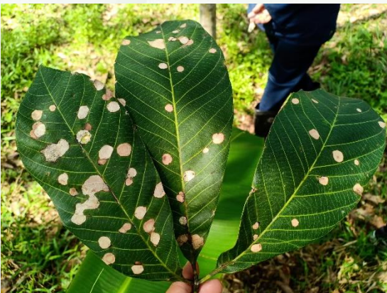
จุดแผลเนื้อเยื่อแห้ง สีน้ำตาลจนถึงขาวซีด